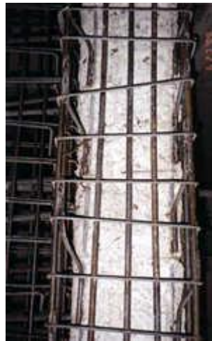
Resim 5 : Tipik Bir Betonarme Kolon Mantosu Donatı Yerleşimi