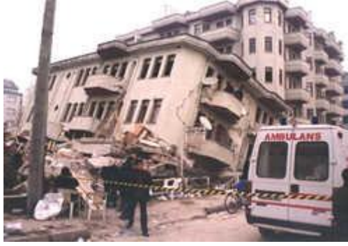
Resim 4 : 17 Ağustos 1999 Marmara Depremi'nde orta hasarlı olarak sınıflandırılan bina, onararak Ekim ayında yeniden yerleşime açılmıştı. Ancak, 12 Kasım 1999 Düzce Depremi'nden sonra 4 katı göçen binanın durumu, yapılan işlemin (yüklenicinin "güçlendirme" yaptığı iddiasına karşın) sistem iyileştirmesi içermediğinin açık olarak kanıtını gözler önüne seriyor.

gözlerimizin önüne seriyor. Ne yazık ki, Düzce'de aynı akibeti paylaşan "onarılmış (!)" başka binalar da var.